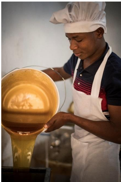
«Bee Village»

Auf der rund vierstündigen Fahrt nach Singida fahren wir quer durch Tansania, vorbei an Feldern und kleinen Dörfern. In Singida und der Umgebung besichtigen wir während zwei Tagen weitere wichtige Projekte von Helvetas. Es geht in den Projekten um bessere Schulbildung, die aktive Mitgestaltung bei der Stadtentwicklung durch die Bewohner*innen, um nachhaltiges Umweltmanagement und die Verbesserung der wirtschaftlichen Situation von Frauen. Wir haben bei jedem Projekt die Möglichkeit, uns mit der lokalen Bevölkerung auszutauschen und mehr über die Herausforderungen aber auch Erfolgserlebnisse zu erfahren.