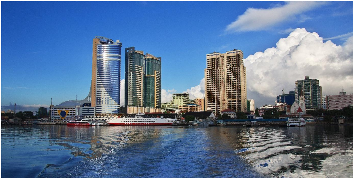
Dar Es Salaam ist das wirtschaftliche und kulturelle Zentrum Tansanias