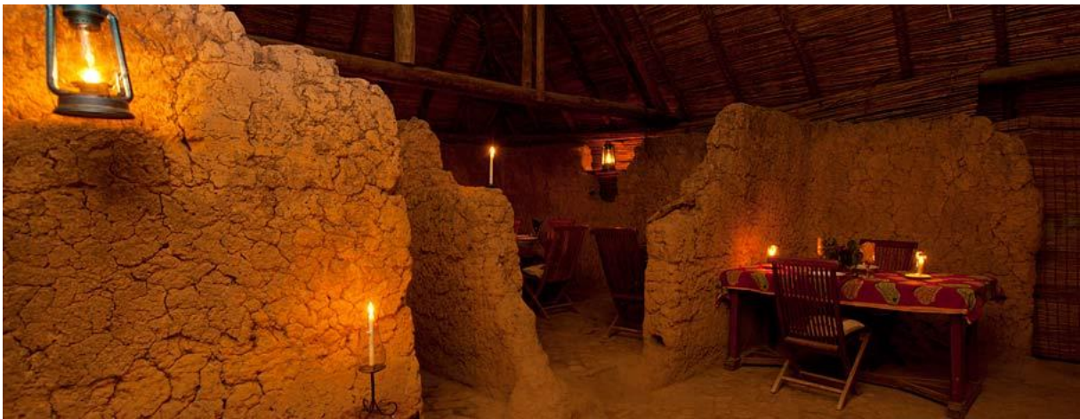
Mud Ruins Restaurant

Wir verabschieden uns von der reichen Tierwelt und fahren nach Kisolanza, wo wir im «Old Farm House» übernachten. Die Farm liegt an den südlichen Hängen des tansanischen Hochlandes und ist schon seit den 1930er Jahren im Besitz der Familie Ghai. Ein besonderer Höhepunkt ist das Mud Ruins Restaurant, welches eine ganz besondere Atmosphäre bietet.