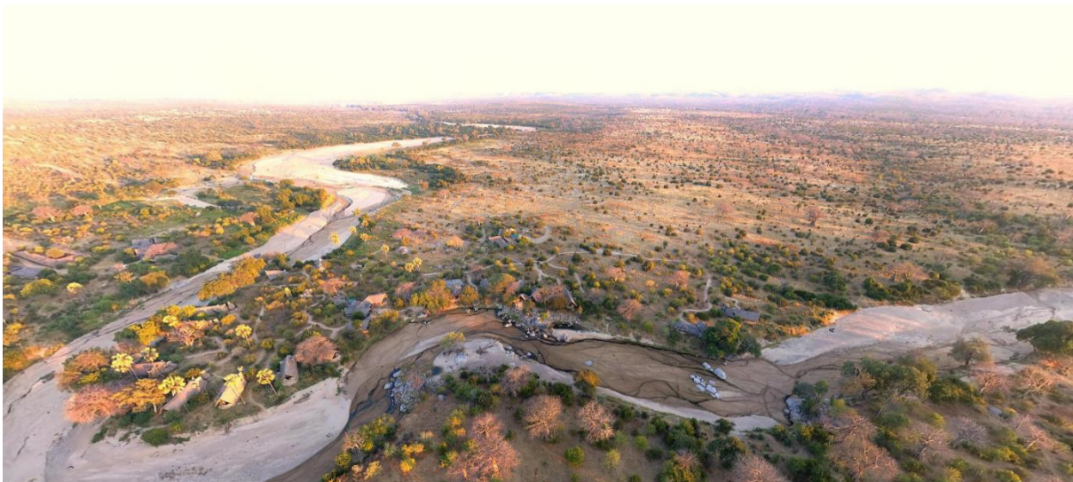
Mwangusi Safari Camp