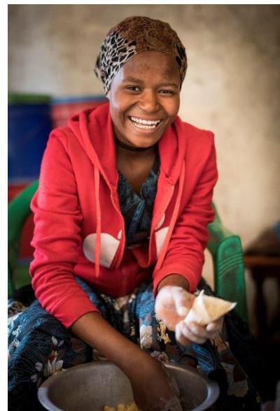
Teilnehmer*innen am YES-Projekt