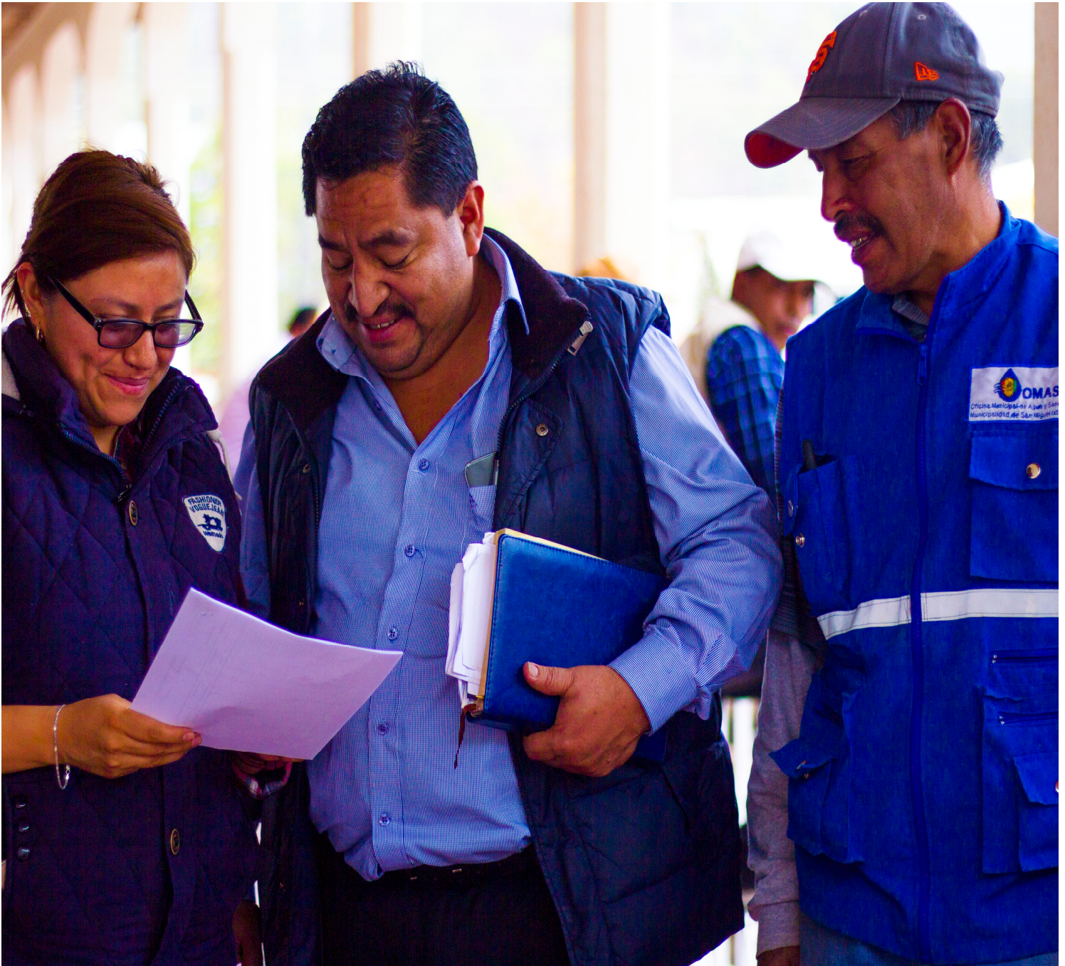
Seguimiento a las acciones de la OMAS de San Miguel Ixtahuacán, San Marcos por parte de la Coordinadora de OMAS, Alcalde Municipal y Fontanero.