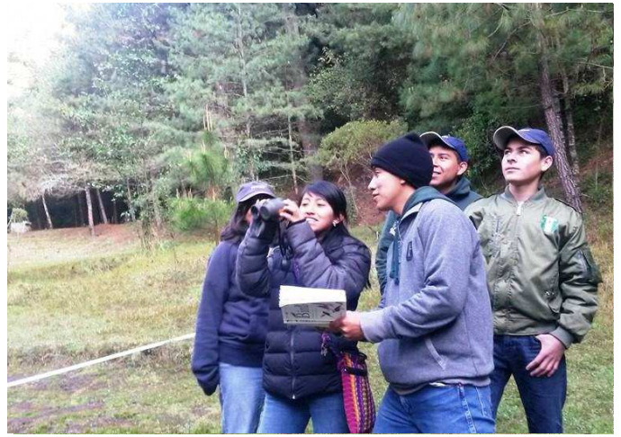
Estudiantes realizando práctica de avistamiento de aves en el Parque Ecológico "Chajil Siwan", en la Comunidad de Chuamazán, Totonicapán.